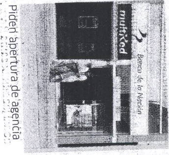
Piden apertura de agencia

A diario cerca de mil personas de dicha localidad viajan a Puno para acudir al BN del cercado de la ciudad.